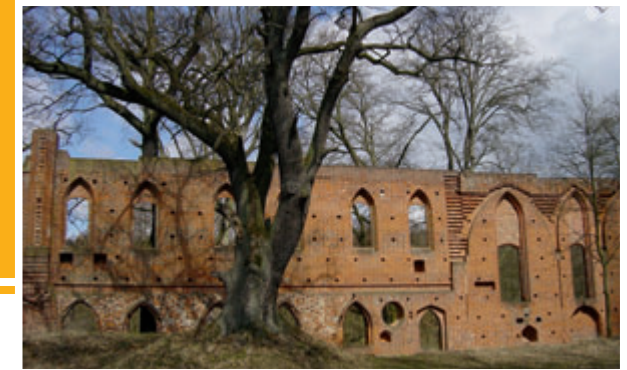
Klosterruine Boitzenburg im Tiergarten