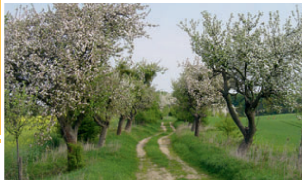
Alte Apfelallee Lichtenhain